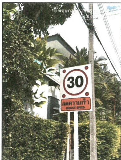
รูปภาพที่ 2.32 ป้ายจำกัดความเร็ว