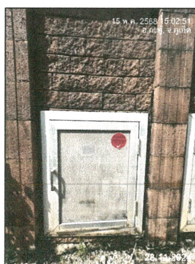
รูปภาพที่ 2.15 ห้องพักขยะบริเวณด้านหน้าของแปลงย่อย