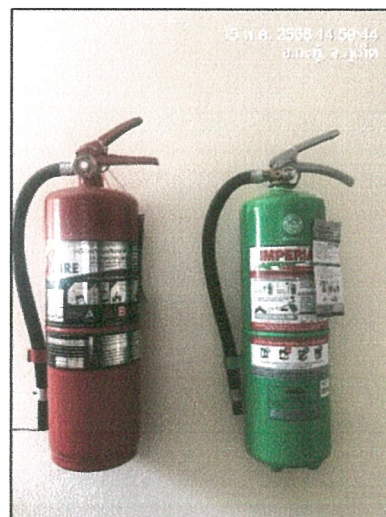
รูปภาพที่ 2.31 ถังดับเพลิงแบบมือถือ