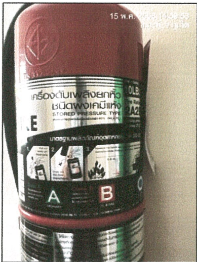
รูปภาพที่ 2.22 ป้ายแสดงวิธีการใช้งานถังดับเพลิง