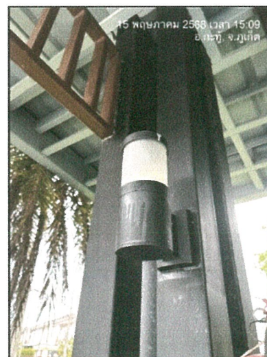
รูปภาพที่ 2.19 หลอดไฟ LED