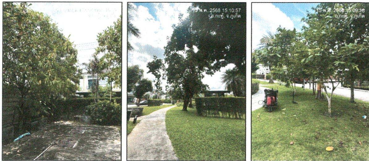
รูปภาพที่ 2.1 พื้นที่สีเขียวภายในโครงการ

รายงานผลการปฏิบัติตามมาตรการป้องกันและแก้ไขผลกระทบสิ่งแวดล้อมและมาตรการติดตามตรวจสอบคุณภาพสิ่งแวดล้อม โครงการจัดสรรที่ดิน THE PLANT (ภูเก็ต) ระยะดำเนินการ ระหว่างเดือนมกราคม - มิถุนายน 2568