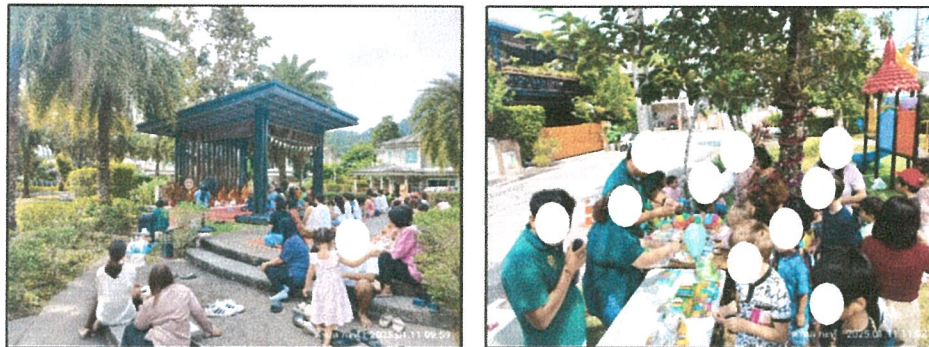
รูปภาพที่ 2.29 กิจกรรมภายในโครงการ