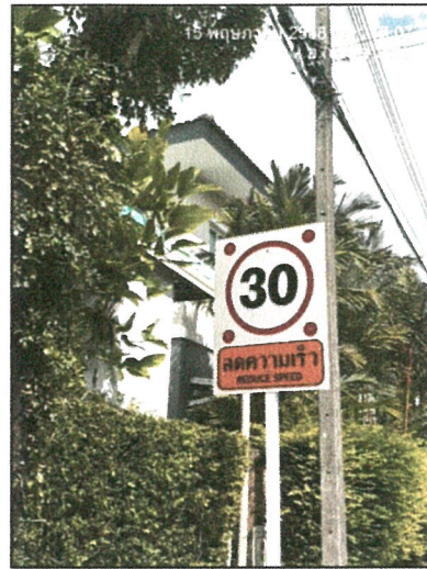
รูปภาพที่ 2.6 ป้ายจำกัดความเร็ว