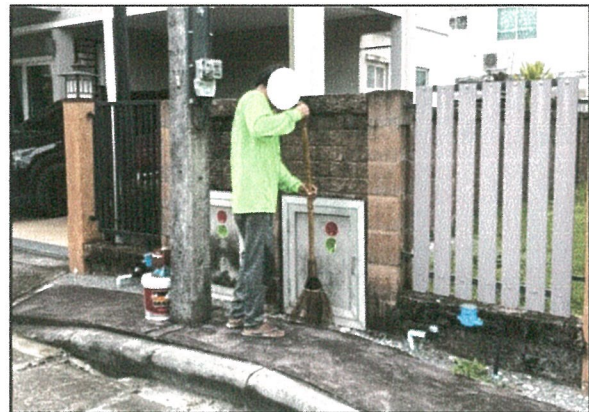
รูปภาพที่ 2.26 ทำความสะอาดจุดพักมูลฝอย