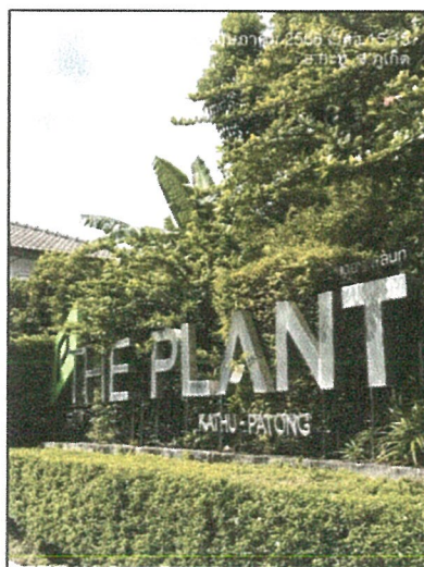
รูปภาพที่ 2.3 ป้ายชื่อโครงการ