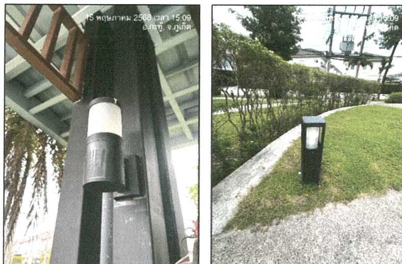
รูปภาพที่ 2.11 ไฟฟ้าส่องสว่าง ภายในโครงการ