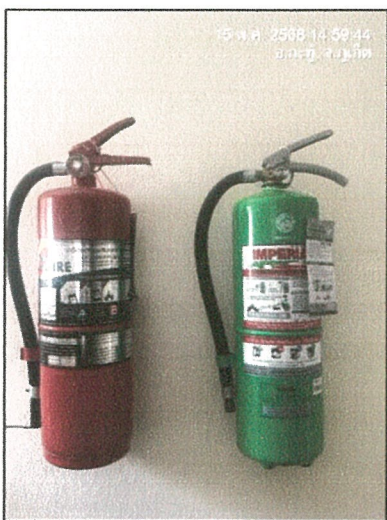
รูปภาพที่ 2.21 ถังดับเพลิงแบบมือถือ