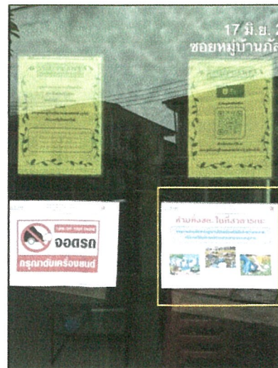
รูปภาพที่ 2.25 ป้ายรณรงค์ทิ้งขยะลงถัง