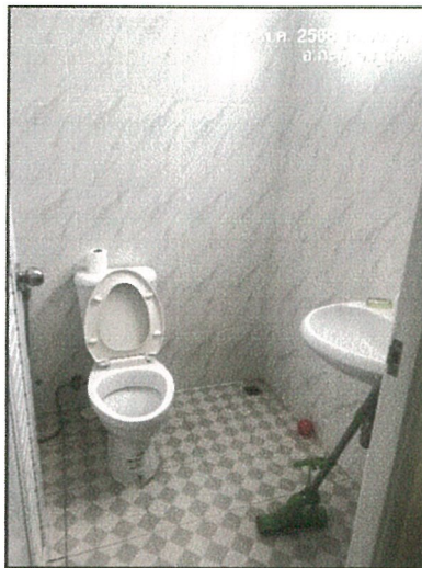
รูปภาพที่ 2.24 สุขภัณฑ์ประหยัดน้ำ