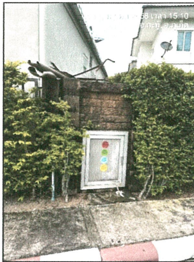
รูปภาพที่ 2.16 ไม้พุ่มโดยรอบห้องพักขยะบริเวณด้านหน้าของแปลงย่อย