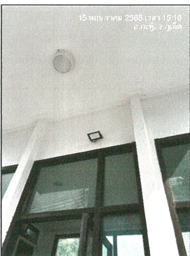
รูปภาพที่ 2.9 ไฟฟ้าส่องสว่าง บริเวณทางเข้า-ออก