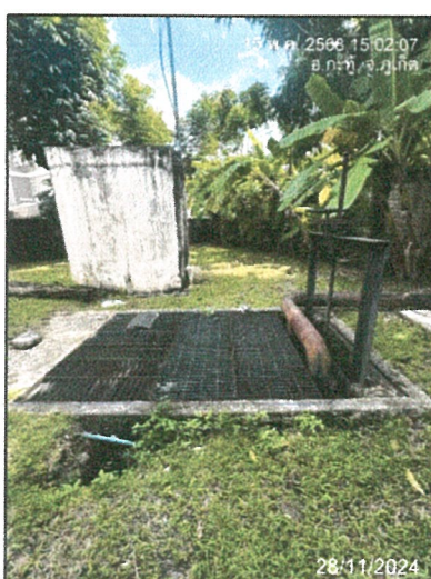
รูปภาพที่ 2.14 ตะแกรงดักขยะ