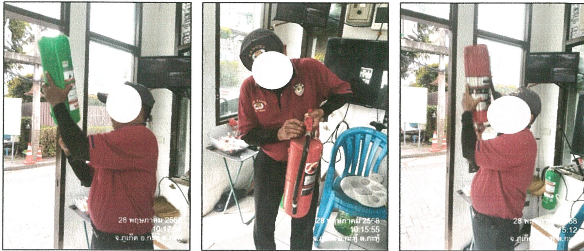
รูปภาพที่ 2.28 ตรวจเช็คถังดับเพลิง