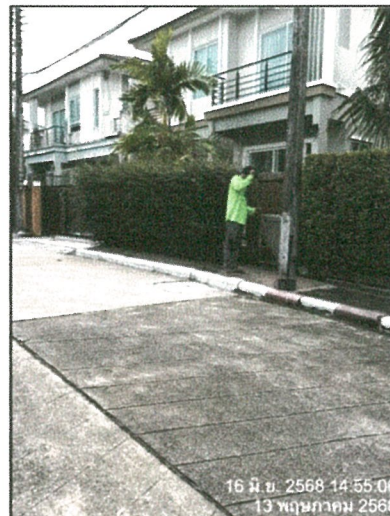
รูปภาพที่ 2.17 การดูแลความเรียบร้อยบริเวณห้องพักขยะด้านหน้าของแปลงย่อย