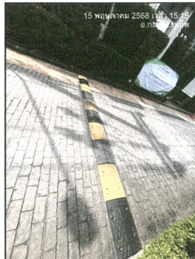
รูปภาพที่ 2.8 สันนูนบนผิวถนน