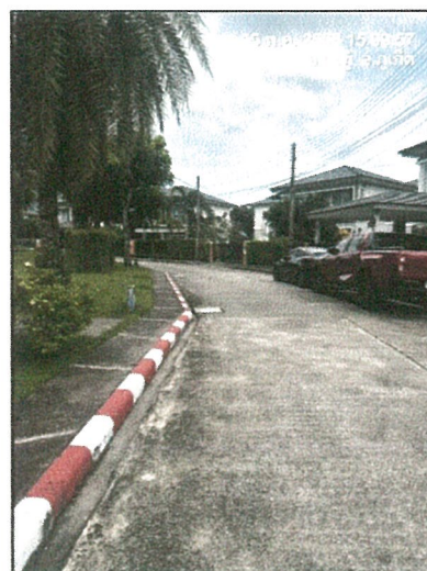
รูปภาพที่ 2.10 เส้นขาวแดง บริเวณไหล่ทางในพื้นที่ห้ามจอดรถ