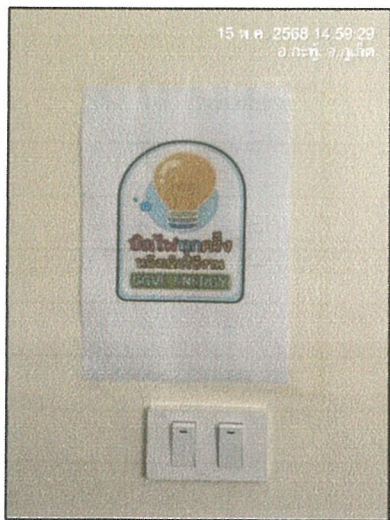
รูปภาพที่ 2.20 ป้ายรณรงค์ประหยัดไฟฟ้า