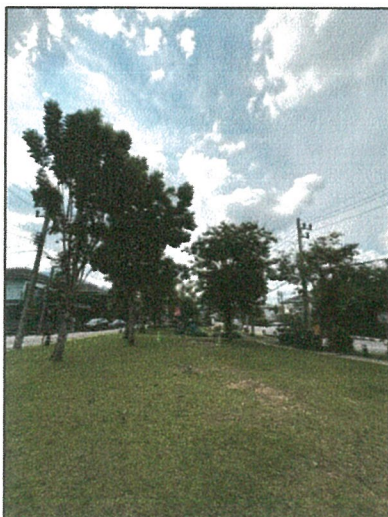
รูปภาพที่ 2.30 พื้นที่ว่างภายในโครงการ