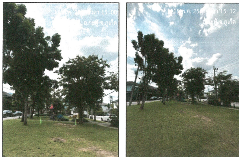
รูปภาพที่ 2.2 จุดรวมพล