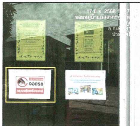
รูปภาพที่ 2.33 ป้ายดับเครื่องยนต์