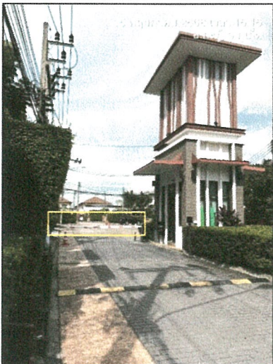
รูปภาพที่ 2.7 ไม่กั้นทางเข้า-ออก