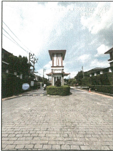
รูปภาพที่ 2.5 ทางเข้า- ออกโครงการ