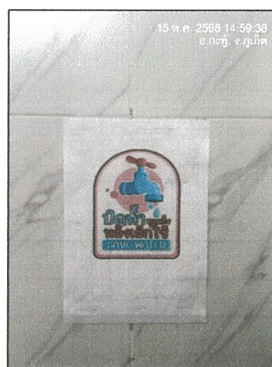
รูปภาพที่ 2.13 ป้ายรณรงค์ประหยัดน้ำ