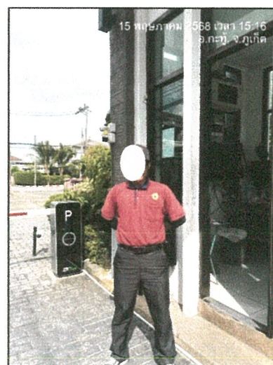
รูปภาพที่ 2.4 เจ้าหน้าที่รักษาความปลอดภัย